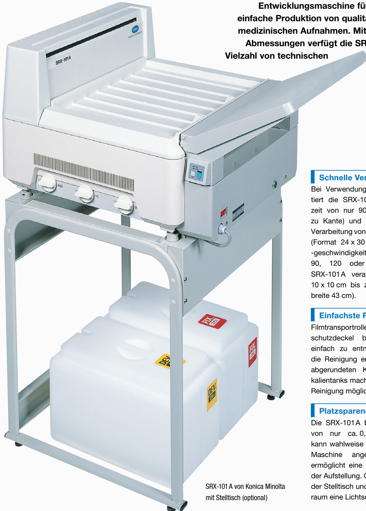
SRX-101A von Konica Minolta mit Stelltisch (optional)

SRX-101A von Konica Minolta – die Röntgenfilm-Entwicklungsmaschine für die schnelle und einfache Produktion von qualitativ hochwertigen medizinischen Aufnahmen. Mit ihren kompakten Abmessungen verfügt die SRX-101A über eine Vielzahl von technischen Besonderheiten.